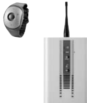
Ensemble téléassistance habitat